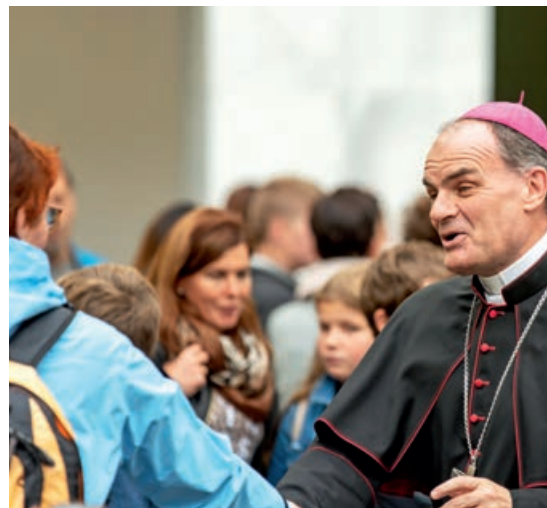
Nella visita pastorale il vescovo Muser avrà decine di incontri con cittadini, istituzioni e associazioni di Bolzano

C'è ovviamente anche molta attesa per i frutti che la visita pastorale potrà portare nelle comunità e nelle parrocchie. “La visita pastorale – osserva don Gretter – sarà sicuramente un'occasione, cosa che già ha cominciato ad essere, per una riflessione su prospettive future alla luce dei tempi che cambiano e dell'esigenza di essere sempre più fedeli al Vangelo. Non ci aspettiamo che il vescovo arrivi con la bacchetta magica, ma già tutto il movimento di confronto e accoglienza possono metterci in quel cammino sino-