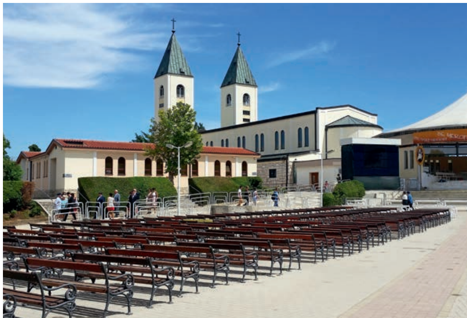
Dalla Nota del Dicastero vaticano l'apertura alla devozione della Madonna a Medjugorie

La Nota del Dicastero inquadra il fenomeno spirituale di Medjugorje all'interno delle "rivelazioni private" il cui scopo non è «quello di "migliorare" o di "completare" la Rivelazione definitiva di Cristo, ma di aiutare a viverla più pienamente in una determinata epoca storica» (Catechismo della Chiesa Cattolica, n. 67).