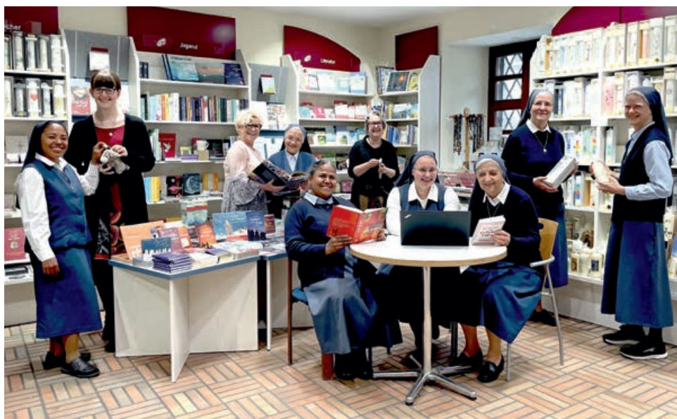
Il team al completo delle Paoline di Norimberga