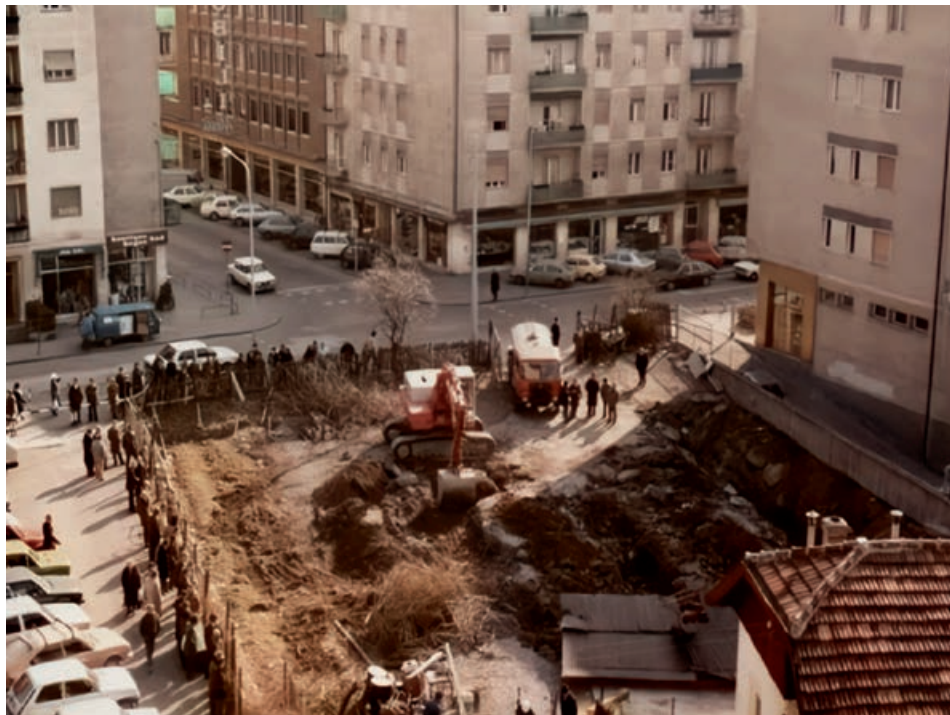
La foto che mostra come appariva 40 anni fa l'incrocio tra via Dalmazia, via Palermo e l'allora nascente viale Europa, punto di contatto tra i territori delle due parrocchie Regina Pacis e Visitazione

Dalla foto si può invece dedurre che un bisogno chiaro ed emergente di quel tempo – ancora oggi molto attuale e allo stesso tempo molto controverso (che non riguarda solo le strade ma molti più ambiti della nostra vita) - era l'urgenza di unire, collegare, comunicare, velocizzare gli scambi per rendere comoda e vivibile la vita di tutti, sotto l'impulso dell'economia, che ha permesso la realizzazione concreta di questa grande richiesta.