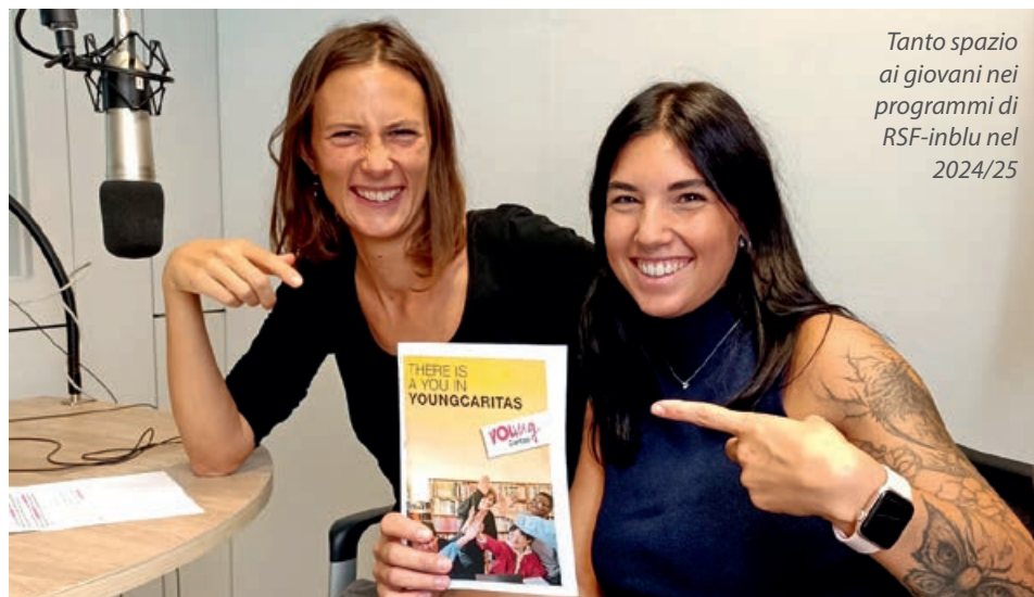
Tanto spazio ai giovani nei programmi di RSF-inBlu nel 2024/25

Programmi di attualità e informazione, rubriche dedicate a sociale, cultura, musica, temi ecclesiali: in ottobre è partita la nuova stagione dell'emittente diocesana Radio Sacra Famiglia inBlu.