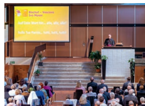
Il vescovo Ivo Muser nella Cusano durante il suo intervento al Convegno pastorale

La terza strada è essere aperti agli altri : "La perdita di significato della Chiesa nella società porta alla tentazione di cercare l'identità cristiana nella separazione e nella polarizzazione. Non esiste per i cristiani un 'noi contro gli al-